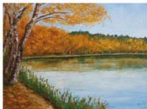
Autunno in Polonia olio su tela cm 50 x 70 globul2004@libero.it

L'opera, ispirata alla natura, ad angoli di grande fascino presenta un realismo romantico carico di colori, di atmosfere e di ricordi. L'artista si compiace di animare la sua pennellata e di muovere i colori per esaltare la bellezza di luoghi amati e vissuti. In un metafisico silenzio il cielo si specchia nell'acqua calma e, insieme agli alberi, rivelano che l'adesione dell'artista alla natura proviene da una ideale visione permeata di poesia.