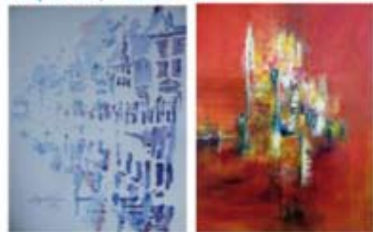
Angelo Pagano Naviglio Grande Milano Acquerello, 70x50