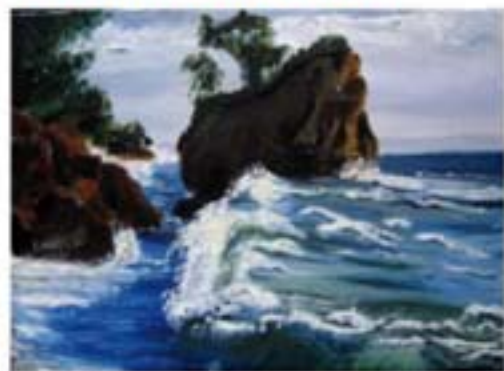
Scogli olio su tela cm 50x70

L'opera Scogli di grande impatto visivo e di chiaro riferimento impressionista ha una tavolozza vivace e incisiva.