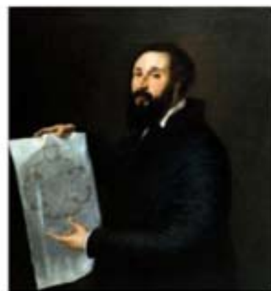
Tiziano Vecellio Ritratto di Giulio Romano 1536 o 1538 olio su tela 102x87

L'ultimo appuntamento con l' Artbox sarà dal 25 marzo al 25 aprile 2010, con il Ritratto di Carlo Caravaggio - 1932-1933, di Mario Sironi.