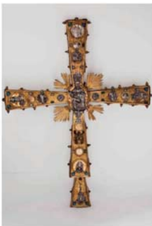
Croce del XV secolo

La Croce di Nagasawa è volutamente posta in relazione con un'antica Croce astile in rame dorato con tondi incisi e integrazioni in argento sbalzato, conservata oggi in San Fedele e originariamente appartenuta alla chiesa di Santa Maria della Scala a Milano. Questa croce, risalente al XV - XVI secolo, ha subito negli anni diversi interventi quasi a testimoniare le differenti fasi dell'esperienza della fede cristiana durante i secoli. Dal punto di vista iconografico la croce presenta medaglioni lavorati a niello e bassorilievi in ar-