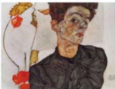
Egon Schiele, Autoritratto con alchechengi , 1912 Olio e vernici opache su tavola; 32x40 cm

La Secessione riconosce all'arte il ruolo