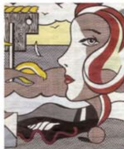
Roy Lichtenstein Figures in Landscape , 1977

L'allestimento punta a illuminare il meglio della produzione di Roy Lichtenstein noto per i suoi "comics". "In quasi mezzo secolo di carriera ho dipinto fumetti e puntini per soli due anni. Possibile che nessuno si sia accorto che ho fatto altro?" Così si esprime nel corso di un'intervista l'artista con una certa impazienza. Vediamo ora questo "altro": donne spezzate alla Picasso, giganteschi pezzi di gruviere assemblati a paesaggio surrealista, geometrie alla Mondrian e prigionieri meccaniche che ricordano Léger. In mostra oltre cento opere (tele, disegni, sculture): la Femme d'Alger del 1963 è una suggestione di colori che rimanda al quasi omonimo quadro di Picasso, cavalli, uomini e l'America dei cowboys. Seguono cubi blu e rossi, enormi sfere luminose, iconografie medievali stilizzate in un allegro alfabeto pop. Sono la raffigurazione delle percezioni del mondo in cui viviamo, fatto di realtà come rappresentazione. Raccontano la realtà prendendo delle copie, a loro volta copie di altro e facendone opere originali. Nell'era della riproducibilità tecnica, copiare non è rubare ma sinonimo di raccontare.