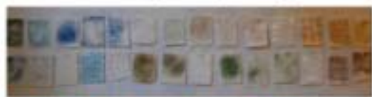
Diario di un giorno qualunque tecnica mista base in tessuto resinato con fogli di porcellana cm 50 x 160 info@terra-blu.it