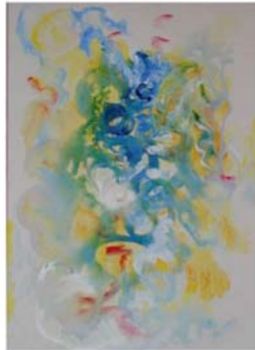
Fumo di diamante acrilico su tela cm 60 x 40 nicolettim@fastwebnet.it

L'opera Fumo di diamante , di chiara estrazione astratta, è carica di significati racchiusi tra le pieghe del colore, nelle sbavature del segno e nel racconto al di fuori di ogni realtà contingente. La tavolozza ben districata e scelta dà all'opera una certa gradevolezza e un aggancio, non solo allusivo, a una metafisica realtà. Agile nelle pennellate, la sua vena narrativa è sorretta da una costante poetica che conduce nel regno dell'immaginario e del fantastico, con una disinvoltura e sicurezza che si evidenziano nell'armonia dei colori.