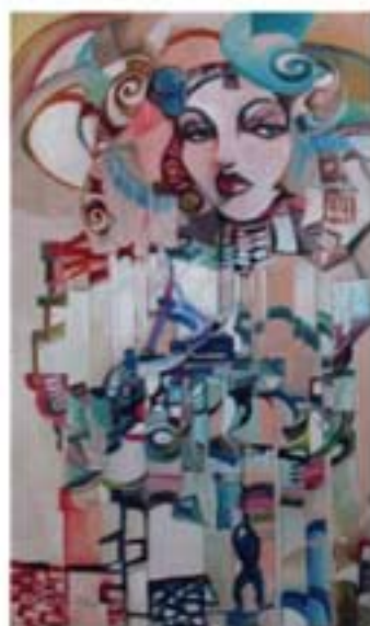
Charlene Tea tecnica mista su tela cm 120 x 60 info@giulianogiuliani.net