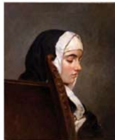
Francesco Hayez La monaca , olio su tela. Collezione privata

Gli eventi della Monaca di Monza sono indagati all'interno di un tema ben più vasto che riguarda la condizione femminile nella prima età moderna, con una particolare attenzione al fenomeno delle monacazioni forzate. L'argomento tocca trasversalmente altri aspetti della reclusione femminile, sempre determinata dall'autorità paterna. Saranno le figure di donne private della libertà: Anna Bolena, Lucrezia Borgia, Pia de' Tolomei e Isabella Orsini - a introdurre il percorso espositivo.