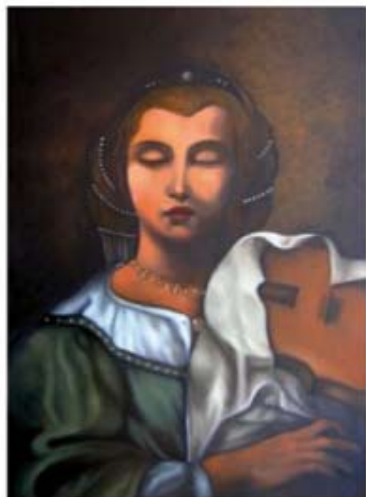
Il silenzio di una nota olio su tela cm 100 x 70 info@pierropasquale.it