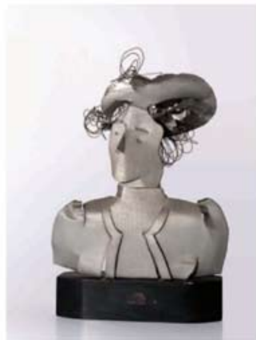
La signora provinciale

Per l'intera durata della retrospettiva è previsto un programma di attività didattiche che prendono spunto dagli aspetti più significativi dell'iter artistico di Regina quali l'innovazione plastica, il disegno, la sperimentazione dei materiali, la suggestione delle tecnolo-