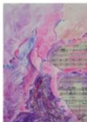
Ballerino tecnica mista cm 30 x 20 info@scegle.it