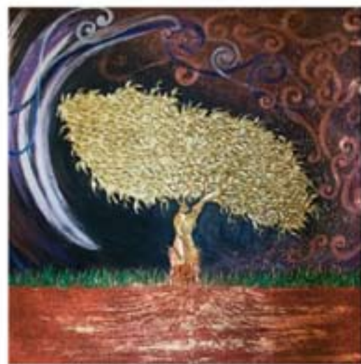
L'abbraccio tecnica mista a rilievo con metalli, 150x150 misci06@fastwebmail.it

L'opera L'abbraccio presenta una figurazione che può essere considerata vicino al surreale-figurativo. L'albero contornato da sciabolate di colore da un lato e dall'altro spirali che giocano in lunghi riccioli, riempiono coreograficamente la tela. Pittura nata dall'intuizione, eppure obbediente a un ordine mentale di una libera interpretazione della vita. Armonie cromatiche, figure e simbolismi danno all'opera quella giusta ricercatezza di esecuzione, arricchendo anche metaforicamente l'amore per la madre terra.