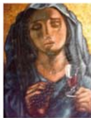
Pasquale Pierro La madre del vino