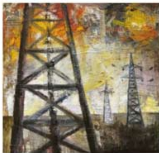
Giovanni Cerri Tralicci , 2008, olio cm 130x130

delle sue città invisibili, anch'esse stracciate e abbandonate ai loro cupi colori.