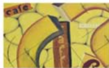
Gianluigi Sartori Luoghi comuni Tecnica mista, 60x80

" La preziosità e le trasparenze dell'acquerello nell'opera: "Naviglio Grande a Milano" mettono in risalto l'equilibrio delle tonalità dell'azzurro, che una vivezza immaginativa e poetica dei sentimenti esalta ".