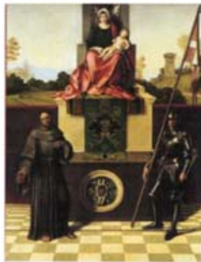
Giorgione Pala di Castelfranco Castelfranco Veneto, Duomo

Informazioni e prenotazioni: Consorzio di Promozione Turistica Marca Treviso tel. 0422.541052 giorgione2010@marcatreviso.it