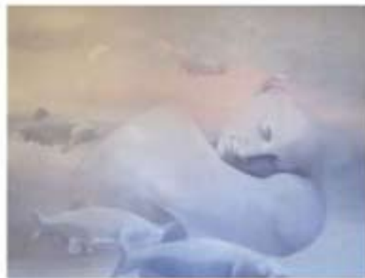
Rem olio su tela cm 60 x 80 pikio@tiscali.it

Il racconto stilistico permette alla pittrice di cogliere l'intimo valore spirituale del soggetto e pone il sogno sullo stesso piano della realtà.