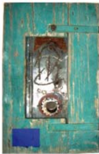
Dziga vertov legno ferro ossidazioni tempere e acrilici info@letiziapini.it